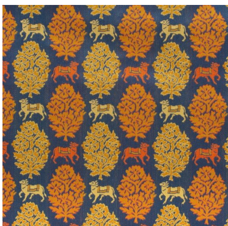
更紗聖牛文(紺) さらさせいぎゅうもん

古代エジプトでは、人々だけでなくそこに住まう動物も皆、来世も現世と同様に幸福な暮らしを送れるよう願う風習がありました。この文様は古代エジプトで、楽園または平和の野原と呼ばれた「イアル野」という野原を描いた壁画を基に、聖牛と崇拝されていた牛とともに意匠化し織り成したものです。