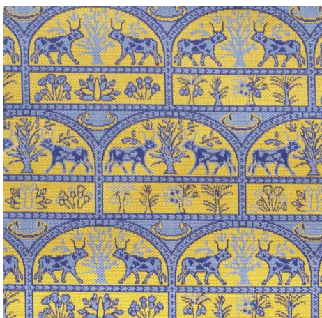
イアルの牛 いあるのうし

古代エジプトでは、人々だけでなくそこに住まう動物も皆、来世も現世と同様に幸福な暮らしを送れるよう願う風習がありました。この文様は古代エジプトで、楽園または平和の野原と呼ばれた「イアル野」という野原を描いた壁画を基に、聖牛と崇拝されていた牛とともに意匠化し織り成したものです。